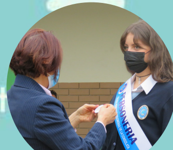
Posesión gobierno escolar