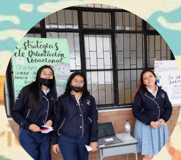
Feria de investigación