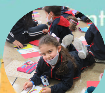
Día del niño