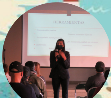
Escuela de padres