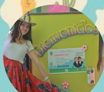
Día del adulto mayor