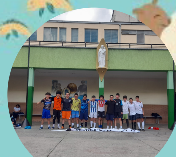
Torneo de fútbol