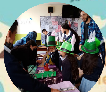
Día San Patricio