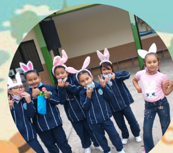
Celebración de la pascua