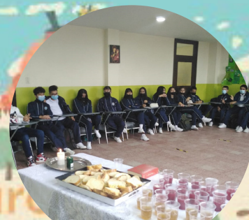
Celebración de la pascua