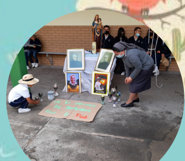
Día de la tierra y el idioma Inauguración intercurros