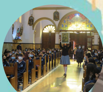
Día de la Consolata