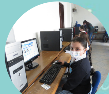
Evaluar para avanzar