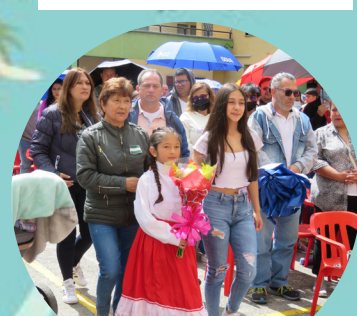
Día de la familia