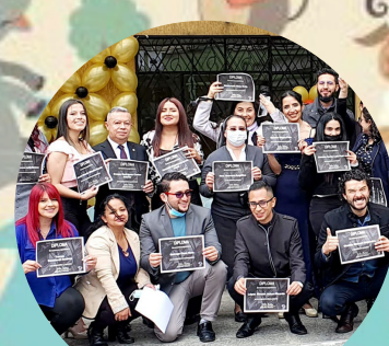
Día del maestro