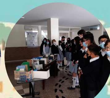
Semana del idioma