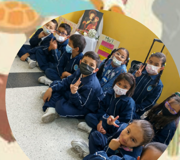
Día de la madre