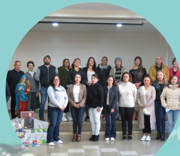
Órganos de participación escolar