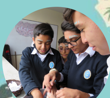
Fiesta del aprendizaje