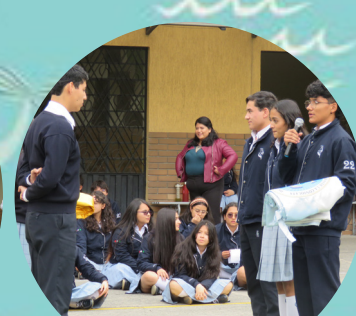
Entrega de símbolos