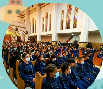
Miércoles de ceniza