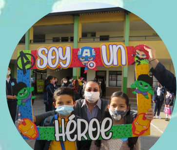
Bienvenida a estudiantes