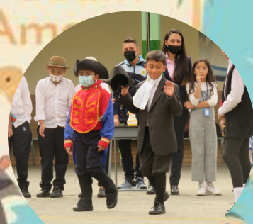
Día de la independencia